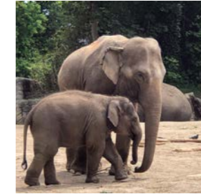
Spaß und Begegnungen für die ganze Familie

Referentin: Antonia Arboleda- Hahnemann Datum: 03.04., 10.04., 17.04. & 24.04.2025, je 18:00–19:30 Uhr Ort: DMSG Hamburg Kosten: 40 € Anmeldeschluss: 20.02.2025 Hinweis: Termine nicht einzeln buchbar