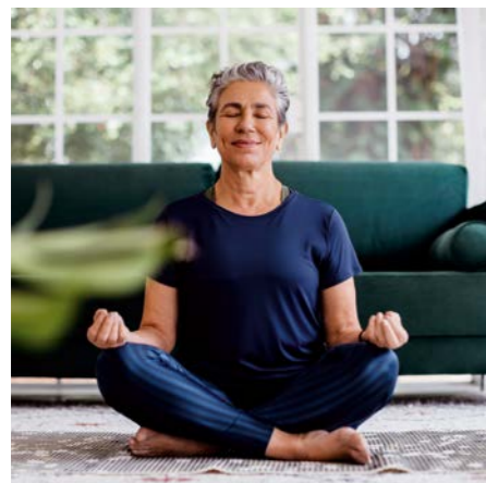
Mentales Training – Verbesserung der geistigen Stärke