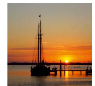
Segelfreizeit – Erlebnisse auf dem Wasser

Referentin: Susann Hauschildt Datum: 22.11.–23.11.2025 Ort: Elsa-Brändström-Haus Kosten: 140 € (inkl. Übernachtung im EZ und Vollverpflegung) Anmeldeschluss: 15.06.2025