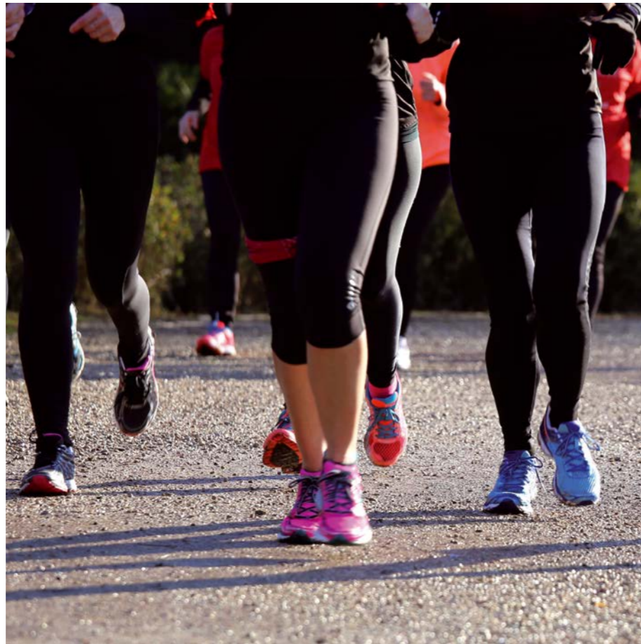
Slow Jogging - Die Trendsportart aus Japan

Leitung: Maurice Köhler Datum: 26.04.2025, 09:30–11:00 Uhr Ort: Strandbistro Glücksburg Kosten: 12 € (16 € Nicht-Mitglieder) Anmeldeschluss: 14.03.2025 Hinweis: Bitte bequeme Kleidung und Sportschuhe für draußen sowie Getränke mitbringen