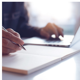
Rechte kennen und Chancen nutzen