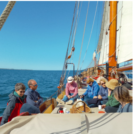
Auf in die dänische Südsee

KURS 20 | ab Kappeln Segelfreizeit Datum: 23.05.2026 – 30.05.2026 Abfahrt/Ankunft: Museumshafen Kappeln Kosten: 350 € Anmeldeschluss: 06.03.2026 Hinweis: 39-Meter-Traditionsse- gelschiff; bei Assistenzbedarf mit Begleitung anmelden