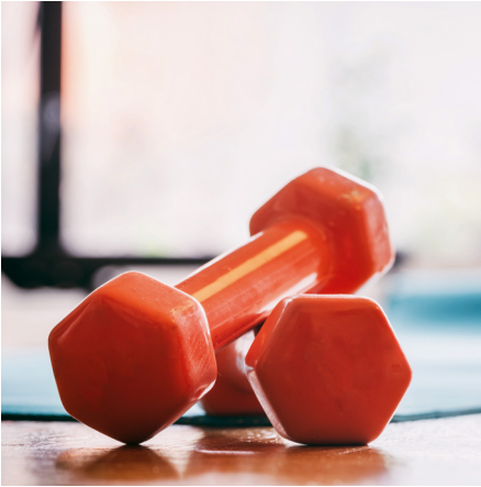
Mit mehr Bewegung in den Herbst

KURS 29 | Hamburg Workshop: Sturzprophylaxe Referentin: Saskia Holtz Datum: 21.11.2026, 10:00 – 12:30 Uhr Ort: DMSG Hamburg Kosten: 25 € Anmeldeschluss: 09.10.2026 Hinweis: Auch für mobilitätseingeschränkte Menschen