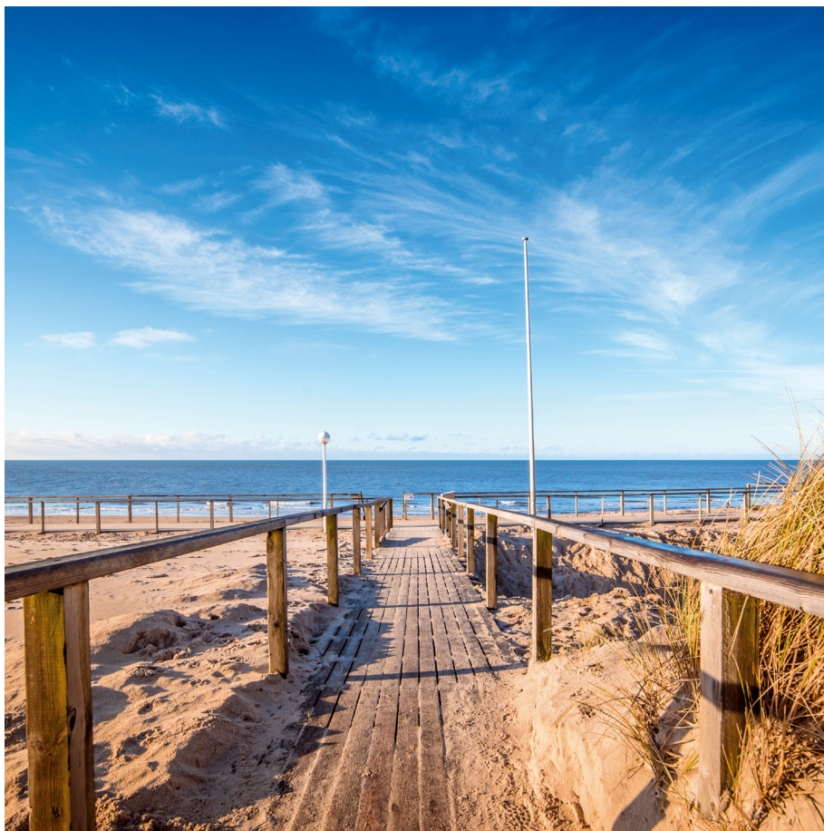
Frische Brise und ein weiter Blick – kleine Auszeit vom Alltag

Hinweis: Preise pro Person (Vollverpflegung, Doppelzimmer)