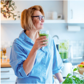
Hilfreiche Tipps und Infos für Frauen mit MS