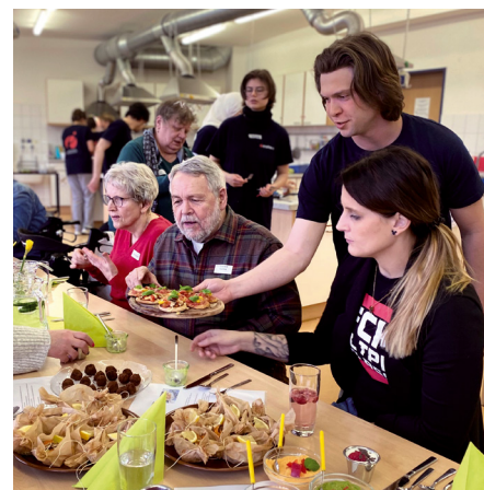
Wohlfühlen auf allen Ebenen – ecolea-Tag im Februar

KURS 61 | Schwerin Ein ecolea-Tag zum Wohlfühlen Leitung: Team der ecolea (Private Berufliche Schule) Datum: 26.02.2026, 10:00 – 14:00 Uhr Ort: ecolea, Schwerin Kosten: 20 € (30 € Nicht-Mitglieder) Anmeldeschluss: 15.01.2026 Hinweis: Physiotherapie, Ergotherapie, Kosmetik, Ernährung