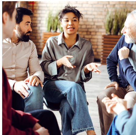
Besser miteinander sprechen