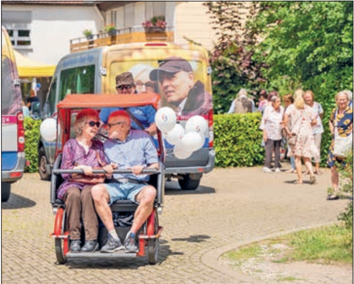
Zahlreiche Besucher waren bei bestem Sommerwetter zum Fest ins Tagespflegehaus gekommen.