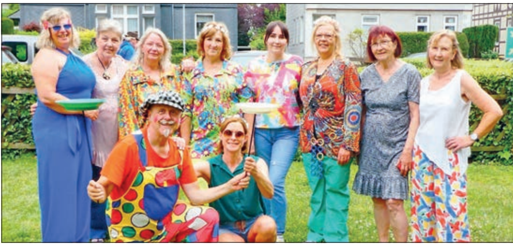
Das Team vom Tagespflegehaus „Neuer Weg“ hatte ein vielseitiges Programm zusammen mit den Tagespflegegästen vorbereitet.

Am gestrigen Sonnabend nach langer Pause: