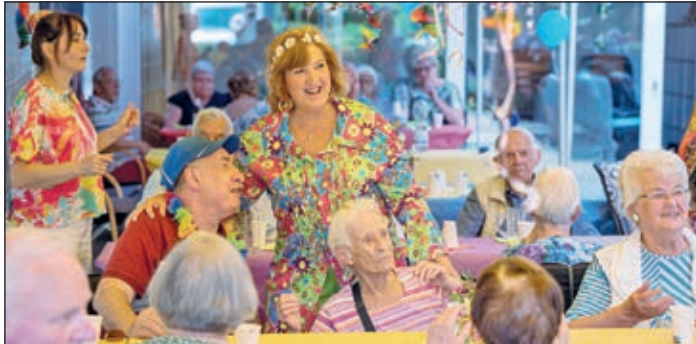
Für gute Laune war beim gestrigen Sommerfest bestens gesorgt.