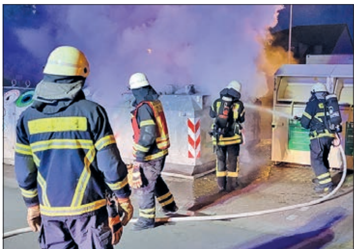
Container waren das Ziel von Brandstiftern.